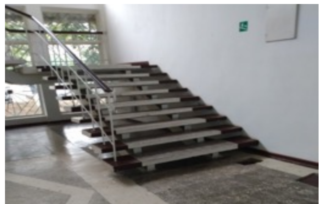
Inspectoratul de Poliție Vulcănești are două intrări, dintre care doar una este dotată cu rampă

Alte inspectorate de poliție sunt practic inaccesibile. În alte clădiri publice situația este similară.