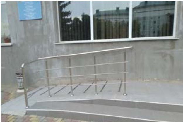
Intrarea în clădirea Judecatoriei din or. Vulcănești