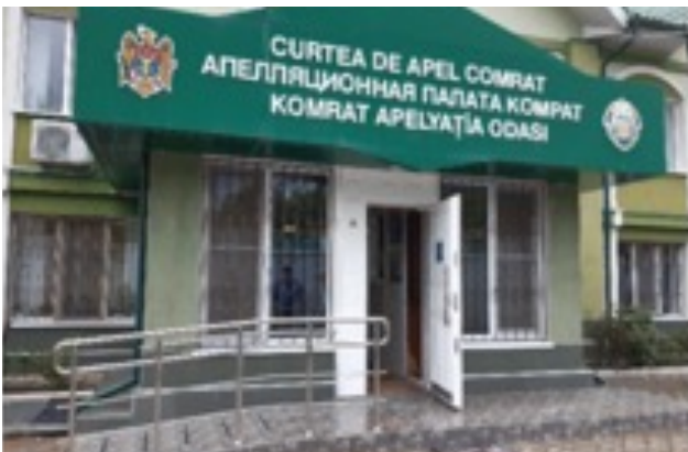
Intrarea în clădirea Curții de Apel Comrat